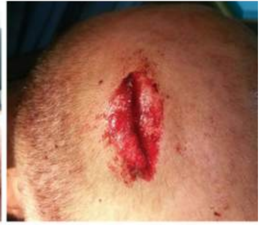
8 minuutin kuluttua

Kun WoundClot asetetaan vuotokohdan päälle ja sitä painetaan kevyesti, se muodostaa kudokseen kiinnittyvän geelin pysäyttäen verenvuodon. Mitä kovempaa verenvuoto on, sitä paremmin hemostaatti kiinnittyy kudokseen. Haavassa ollessaan side muuttuu nopeasti geelimäiseksi.