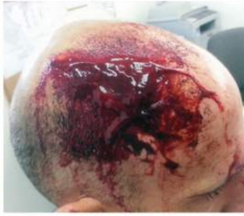
6 minuutin kuluttua