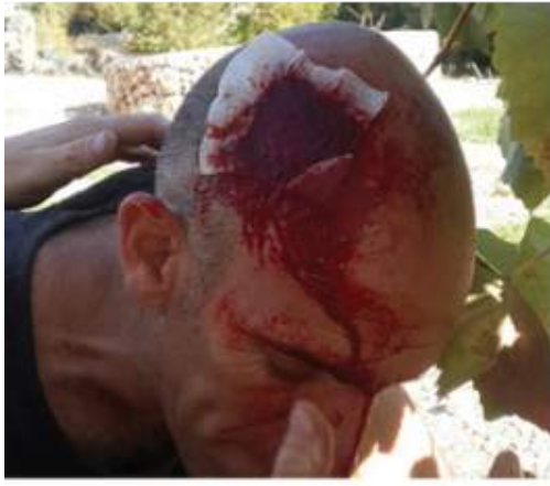
2 minuutin kuluttua